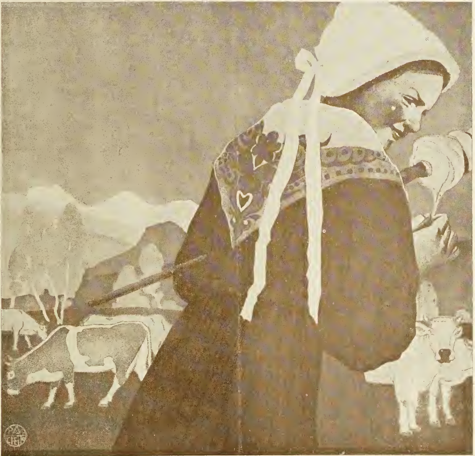
ESCENA DE LA VIDA EN LOS VALLES